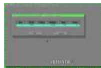
ghost3.jpg 372x245x16.7 Mio [11 KB]

Om een image file te maken kies Dump Partition to image file en druk op Enter