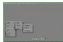
ghost7.jpg 369x245x16.7 Mio [9 KB]

Tijp nu de naam van de image file die je wil terug zetten en druk op Enter