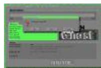
ghost6.jpg 371x246x16.7 Mio [15 KB]

geef de locatie en bestands naam op en druk op Enter