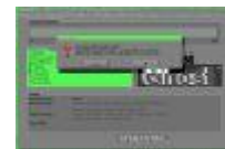
ghost11.jpg 352x232x16.7 Mio [14 KB]

Kies de plaats waar de image moet komen en druk op Enter