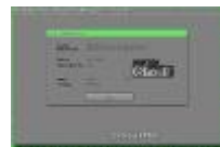
ghost1.jpg 430x282x16.7 Mio [13 KB]