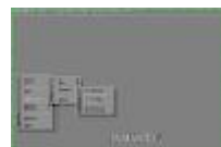
ghost2.jpg 369x242x16.7 Mio [9 KB]

Kies Local - Partition - To Image en druk op Enter