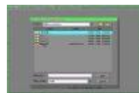
ghost8.jpg 369x244x16.7 Mio [13 KB]

Kies de image die je wilt terug zetten en klik op Ok