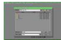
ghost5.jpg 369x245x16.7 Mio [13 KB]

Kies de harddisk waar u een image wilt van maken en druk op Enter