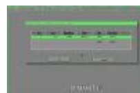
ghost9.jpg 369x244x16.7 Mio [12 KB]

Kies de harddisk waar de image moet komen en klik op Ok